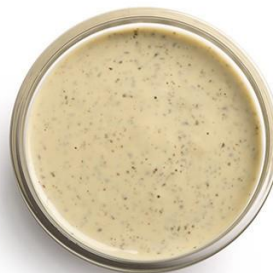
SAUCE SALADE Flacon souple de 850g Réf. 238515