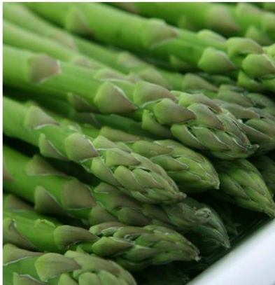
ASPERGE VERTE ❄️ Sachet de 600g Réf. 114394