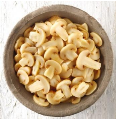
CHAMPIGNON ÉMINCÉ ❄️ Sachet de 2,5kg Réf. 118244