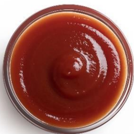
SAUCE BARBECUE Flacon souple de 850g Réf. 238507