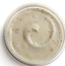
SAUCE CAESAR Flacon souple de 850g Réf. 238955