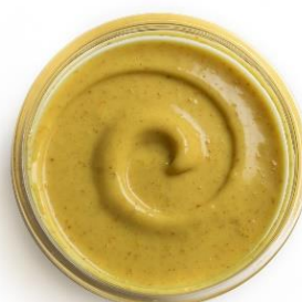
SAUCE CURRY Flacon souple de 850g Réf. 238506