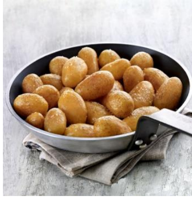
POMME DE TERRE GRENAILLE À L'HUILE D'OLIVE ❄️ Sachet de 1,5kg Réf. 108166