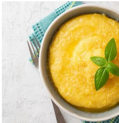
POLENTA FINE Sachet de 1kg Réf. 184595