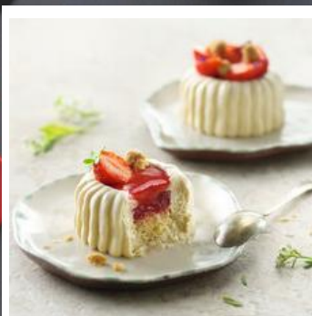
ENTREMET INTENSE FRAISE Composé d'une crème vanille, d'une compotée de fraise, d'un biscuit, d'un coulis de fraise et d'un croustillant au chocolat blanc. Pièce de 85g / Colis de 16 pièces Réf. 55878