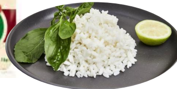
RIZ ARBORIO Sachet de 1kg Ref. 184597