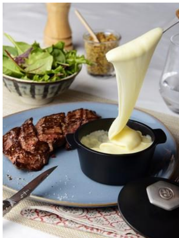
ALIGOT PRÊT A SERVIR

Purée de pommes de terre, tomme fraîche, crème, sel, ail. Sachet de 2,750kg Réf. 9274