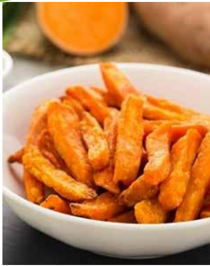
FRITES DE PATATE DOUCE 10/10 Sachet de 1kg / Colis de 10 sachets Ref. 29527