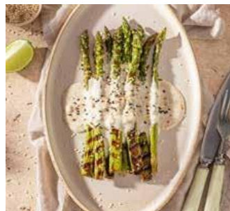
ASPERGE VERTE Sachet de 1kg Colis de 10 sachets Réf. 208007