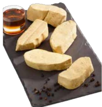
ESCALOPE FOIE GRAS CRUE ORIGINE UE Pièce de 50g env / Sachet de 1kg Réf. 112747