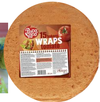
WRAP TOMATO Tortilla de blé à la tomate Pièce de 30 cm / Sachet de 15 pièces Ref. 176808