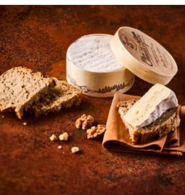
CREMEUX DU JURA

Pâte molle à croûte fleurie Lait pasteurisé de vache 23% de M.G. sur produit fini LAIT ORIGINE FRANCE Pièce de 250grs / Colis de 6 pièces Réf. 177321