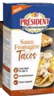
SAUCE FROMAGÈRE SPÉCIALE TACOS Sauce à base de crème légère et d'emmental. Brique de 1 litre – Colis de 6 Ref. 144489