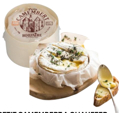
PETIT CAMEMBERT A CHAUFFER ROUZAIRE

Pâte molle à croûte fleurie Lait pasteurisé de vache 20% de M.G. sur produit fini Pièce de 150grs / Colis de 8 pièces Réf. 103172