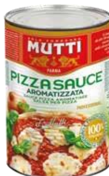
SAUCE PIZZA AROMATISÉE Boîte 5/1 – Colis de 3 boîtes Ref. 178389