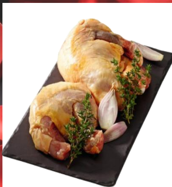
SUPRÊME DE PINTADE ORIGINE FRANCE Pièce de 180/220g / Colis de 5kg Réf. 111558