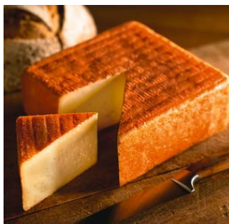
MAROILLES AOP NOUVION

Pâte molle à croûte lavée Lait pasteurisé de vache 26% de M.G. sur produit fini Pièce de 750grs Réf. 57857